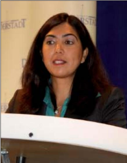
„QiN bietet vielfältige Möglichkeiten zur Förderung innovativer Projekte in Städten und Gemeinden aller Größenordnungen – ideal für ein Flächenland wie Niedersachsen“, betonte Sozialministerin Aygül Özkan.