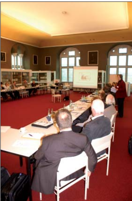
Etwa 40 Vertreter von Städten und Quartiersinitiativen sowie weitere Interessierte waren der Einladung des Niedersächsischen Sozialministeriums nach Helmstedt gefolgt.

Anschließend schritt die Ministerin zur Preisverleihung. Nacheinander ehrte sie die Projekte aus Ankum („Aktiv für Ankum“), Bad Bederkesa („Wir machen unseren Ortskern fit für die Zukunft!“), Bardowick („Jetzt oder nie: Pieperstraße und Große Straße stellen sich auf und werden aktiv!“), Bohmte („Raum für Mehr“), Emden („QiN – Ein Gewinn für das Faldern-Quartier“), Emsbüren („Markt / In der Maate: Vom Hinterhof zur Ortsmitte“), Göttingen („Beleben durch Verbinden“), Helmstedt („Herzstück Neumärker“), Hildesheim („charmant & kompetent – Wegweisend“), Leer („Büntingplatz als erster Impulsgeber – die Leeraner Altstadt startet durch“), Nienburg („1000 Jahre Leinstraße – und weiter geht’s“), Nordenham („WeserWasserLicht“), Osnabrück („Quartiersmanagement Heger-Tor-Viertel“), Ostercappeln („Starke Mitte – Lebenswertes Zentrum“), Salzgitter („Salzgitter-Bad: Wir geben der Altstadt die Würze!“), Springe („Uns geht ein Licht auf! – Licht am Markt!“), „Wittingen ... warum in die Ferne schweifen, das Gute liegt so nah?“), Wolfenbüttel („Leben und Arbeiten zwischen Schlossplatz und Ziegenmarkt – ein Gestaltungsregelwerk für die Fußgängerzone“) und Wolfsburg („Belebung durch Wandel – Kampfstraße in Wolfsburg-Fallersleben“).