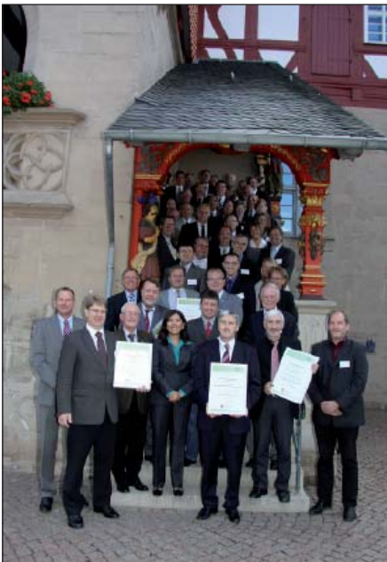
Im Anschluss an die Preisverleihung QiN 2010 stellten sich Ministerin Özkan und die stolzen Siegerinnen und Sieger zum Gruppenfoto vor dem Historischen Rathaus der Stadt Duderstadt auf.

Wie in den Vorjahren stelle das Land auch 2010 eine Mio. Euro Fördermittel zur Verfügung. Die tatsächliche Fördersumme sei angesichts der privaten Investitionen und kommunalen Anteile noch höher. Das gesamte Projektvolumen habe für die 48 Projekte, die von 2007 bis 2009 gefördert wurden, weit mehr als 6 Mio. Euro umfasst. „QiN bietet vielfältige Möglichkeiten zur Förderung innovativer Projekte in Städten und Gemeinden aller Größenordnungen – ideal für ein Flächenland wie Niedersachsen“, betonte Özkan. In keinem anderen Bundesland gebe es so viele Projekte, die auf der Idee des sogenannten „Business Improvement Districts“ (BID) auf freiwilliger Basis umgesetzt werden.