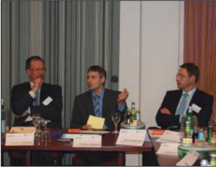
Bei der Planungswerkstatt in Nordenham ging es u. a. darum, grundlegende Zielsetzungen, Prioritäten und ein umfassendes Meinungsbild zu ermitteln.