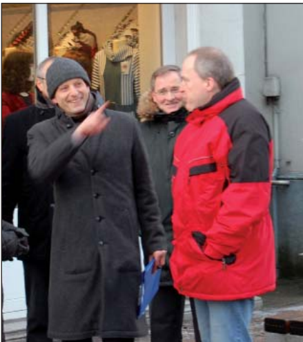
Die Teilnehmer des Workshops glichen die Ergebnisse ihrer Analyse im Rahmen einer Ortsbegehung durch die nördliche Fußgängerzone ab.