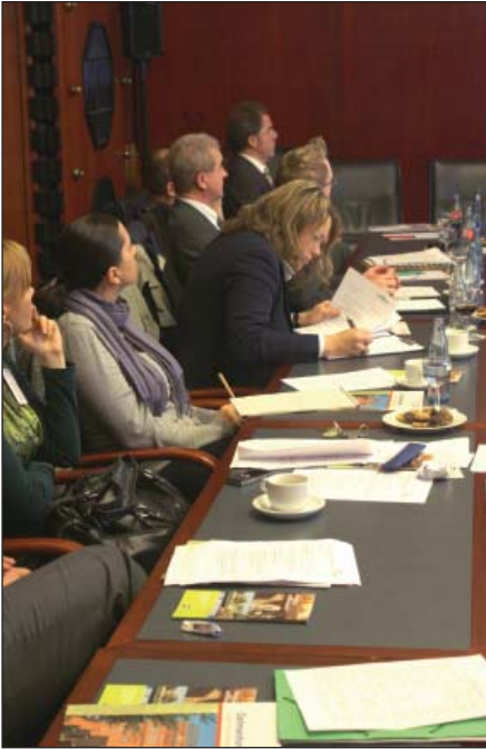
Über 40 Vertreterinnen und Vertreter der siegreichen QiN-Projekte waren der Einladung des Niedersächsischen Sozialministeriums nach Delmenhorst gefolgt.