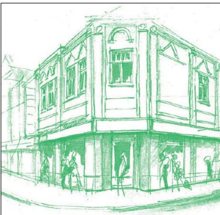
Eine Kernaktion in Nordenham ist der Rückbau von Ladenlokalen in einem Wohn- und Geschäftshaus.