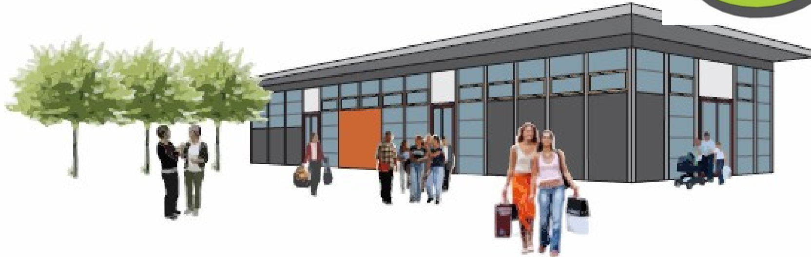
Ansicht Markthalle von Nord-West