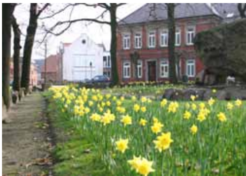
Pflanzaktion „Steinfeld blüht auf“