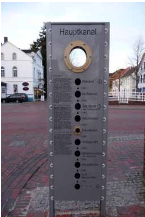
Stele „Hauptkanal“ mit Bullauge

Als Anlaufpunkt wurde ein leer stehendes Ladenlokal als „Quartierskontor“ eingerichtet und im Rahmen einer Anliegerversammlung am 12. November 2008 eröffnet. In diesem „Kontor“ fanden alle 14 Tage Beratungsangebote für Eigentümer statt. Aufgrund der vom Quartierskontor vermittelten Neuvermietung musste das Kontor innerhalb des Bearbeitungszeitraums umziehen. Das Quartierskontor bot von November 2008 bis einschließlich November 2009 insgesamt 39 Öffnungs- und Beratungstage an. In dieser Zeit wurden 68 Beratungen von Immobilieneigentümern und gewerblichen Interessenten durchgeführt.