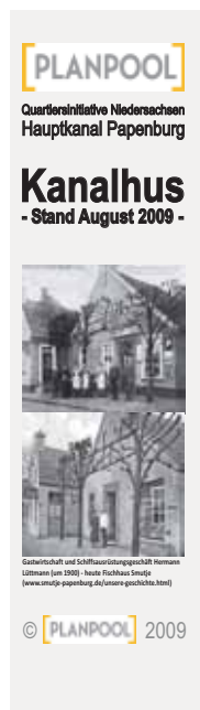
typisches Kanalhaus - Backsteinoptik