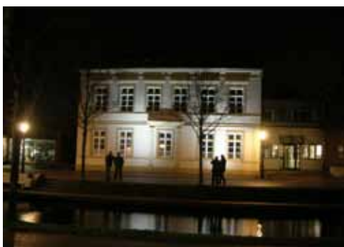
Akzentuierte Beleuchtung des Hauptkanals

Das Quartier „Am Hauptkanal“ ist die historische Stadtmitte und der traditionelle Einzelhandelsstandort der Stadt Papenburg. Die besondere Entwicklungsgeschichte als „Fehnkolonie“ bedingt, dass diese „Stadtmitte“ keine räumliche Konzentration darstellt, sondern durch einen lang gestreckten Kanal geprägt ist, der beidseitig mit Wohn- und Geschäftshäusern bebaut ist. Durch zwei Shopping-Center, die sich im Nordwesten unmittelbar an das Quartier anschließen, wird dem Hauptkanal als Standort des traditionellen (inhabergeführten) Facheinzelhandels zunehmend Kundenpotenzial entzogen und droht zu einer 1b-Einkaufslage zurückgedrängt zu werden. Der Hauptkanal bildet die wichtigste Wegebeziehung und Verbindung zwischen zwei touristischen Anziehungspunk-