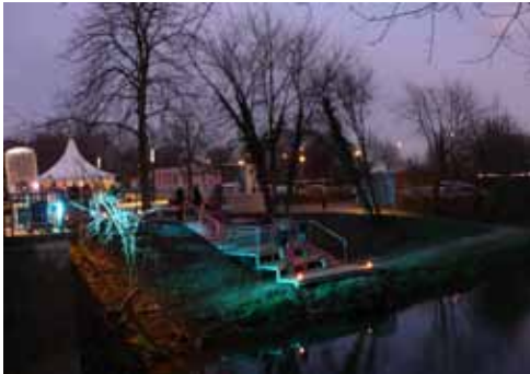
Steg bei Nacht