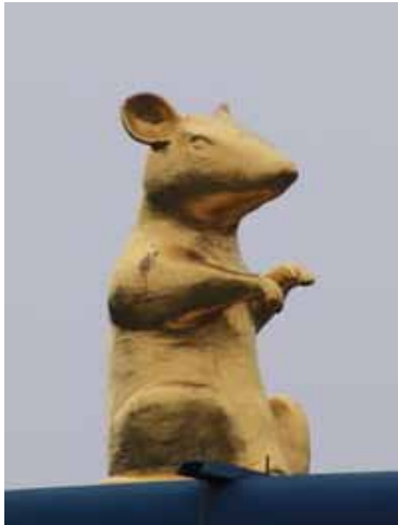
Firmenwegweiser „Goldene Ratten“