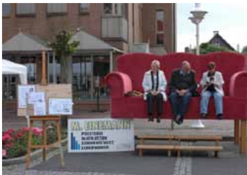
„Nehmen Sie Platz“ - auf dem Marktplatz