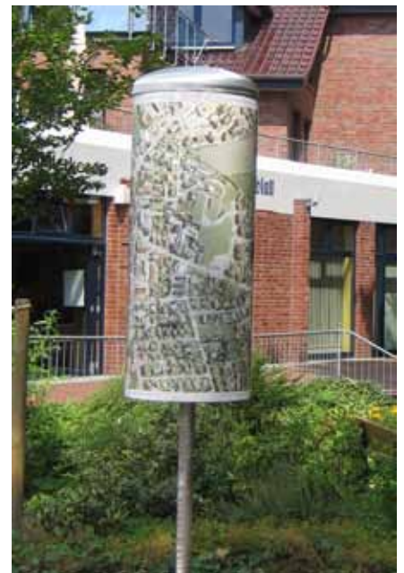
Einkaufs- und Dienstleistungswegweiser