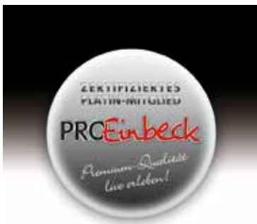
Marke / Qualitätssiegel