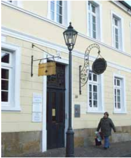
Schlosstraße Nr. 10

beiten durchgeführt werden. Auch der Rückbau von Gebäuden, die Entfernung großflächiger Schaufenster sowie eine komplette Umgestaltung der Fassadengestaltung wurden vorgenommen. Besonders wichtig ist zudem die Auswahl einer passenden Werbung und Beleuchtung am Gebäude. Auch ein historischer Apothekergarten wurde zur Abrundung der Neugestaltungen angelegt. Durch das Engagement der Eigentümer und die gegenseitigen Hilfestellungen und Beratungen erstrahlen die Gebäude jetzt in einem neuen Glanz.