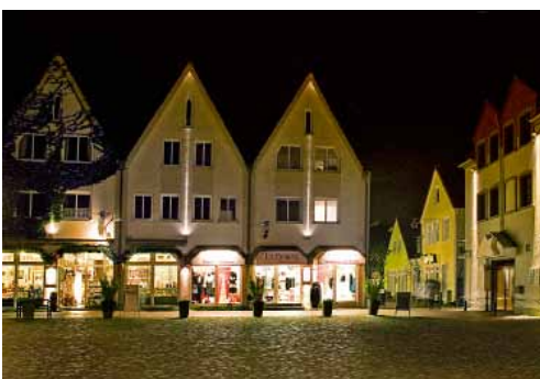
Herbergstraße 2 - 4